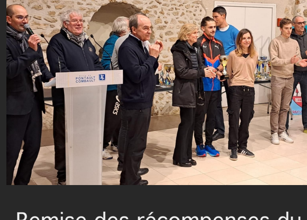
Remise des récompenses du Challenge Trail