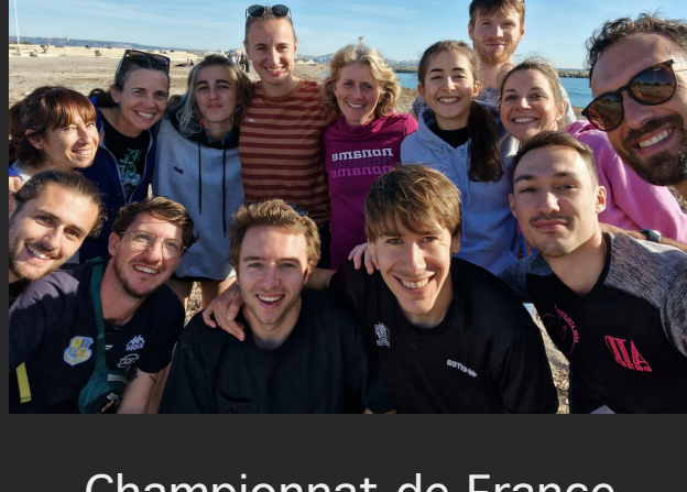
Championnat de France d'Ekiden